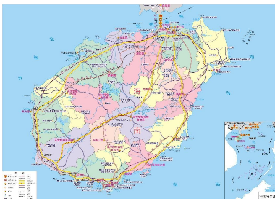
图 2-1 海南省区域地图

海南省位于中国最南端，简称琼，省会海口。海南省是中国的经济特区、自由贸易试验区（港）。位于中国华南地区，北以琼州海峡与广东划界，西临北部湾与广西、越南相对，东濒南海与台湾对望，东南和南部在南海与菲律宾、文莱、马来西亚为邻。海南岛岛屿轮廓形似一个椭圆形大雪梨，地势四周低平，中间高耸，呈穹隆山地形，以五指山、鹦哥岭为隆起核心，向外围逐级下降，由山地、丘陵、台地、平原等地貌构成。海南属热带海洋性季风气候，全年暖热，雨量充沛。