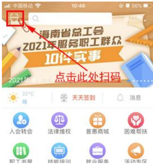
“海南工会云” APP 主页面